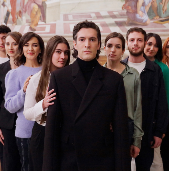
conversa con gli autori

Un viaggio, un'indagine intima di Giovanni Caccamo, alla ricerca delle idee di cambiamento della sua generazione. È il continuum del suo ultimo album "Parola", in cui il cantautore ha raccolto l'appello di Andrea Camilleri, che chiese ai giovani di far partire un umanesimo della parola.Attraverso quindici simposi universitari e un concorso di idee online Caccamo ha lanciato una domanda appello a tutti i giovani italiani: "Cosa cambieresti della società in cui vivi e in che modo?". A questa domanda hanno risposto, per iscritto, oltre novecento ragazzi. Parola ai giovani vuole accendere una luce, rispondere all'urgenza di mettere a fuoco l'imprescindibile importanza della parola e del concetto di cambiamento: motore in grado di accendere immaginazione, consapevolezza e determinazione.